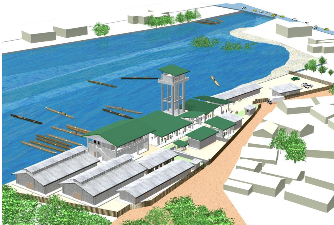
Maquette du centre de pêche de Kaporó (vue sur terre)

dimensionnement des composantes du projet et a procédé à la détermination des responsabilités des deux parties dans la mise en œuvre du Projet.